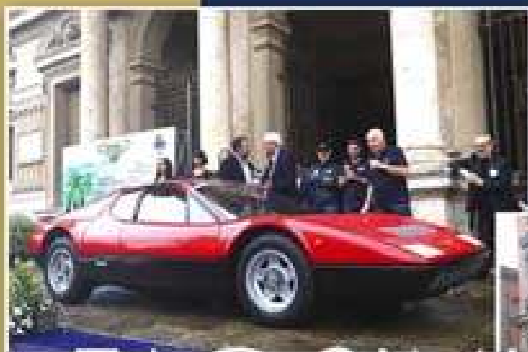
VINCITRICE 1° PREMIO CATEGORIA MODERNA FERRARI 360 GT BARCHETTA del 1974