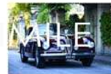
CAR. TOURING SUPERLEGGERA « BEST OF SHOW 2021 A.R. 6C 2500 SS VILLA D'ESTE del 1949