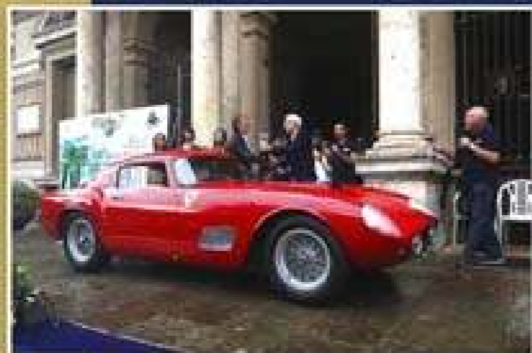
VINCITRICE 1° PREMIO CATEGORIA DOPOGUERRA FERRARI 250 GT TOUR DE FRANCE del 1957