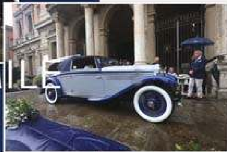
COPPA DEL PUBBLICO LANCIA PI LAMBDA BLUE SHADOW del 1930