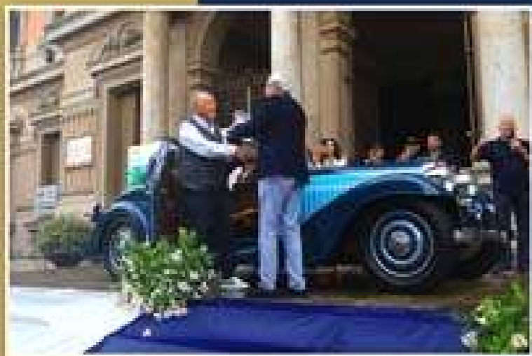
VINCITRICE 1° PREMIO CATEGORIA ANTEGUERRA BUGATTI 57 VENTOUX del 1934